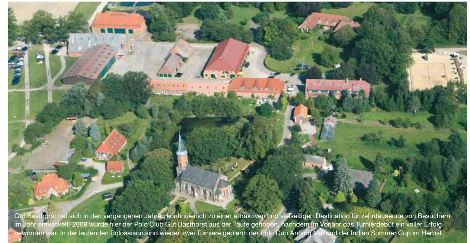
Gut Basthorst hat sich in den vergangenen Jahren kontinuierlich zu einer attraktiven und vielseitigen Destination für zehntausende von Besuchern im Jahr entwickelt. 2009 wurde hier der Polo Club Gut Basthorst aus der Taufe gehoben, nachdem im Vorjahr das Turnierdebüt ein voller Erfolg geworden war. In der laufenden Polosaison sind wieder zwei Turniere geplant: der Polo Cup Anfang Mai und der Indian Summer Cup im Herbst.